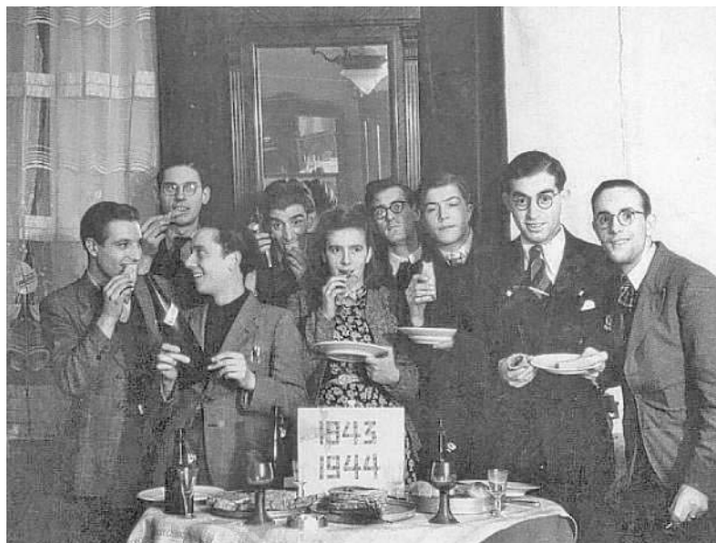
Kerst- en Oud- en Nieuwjaarsviering 1943/44