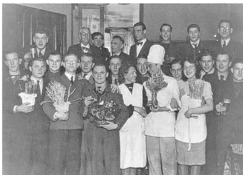
In het restaurant "Alter Fritz"